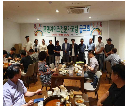
골프회 월례 라운딩 초청