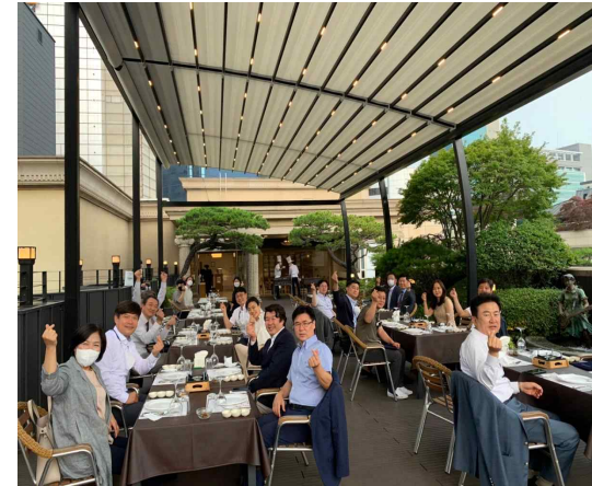
수료식 축하 만찬